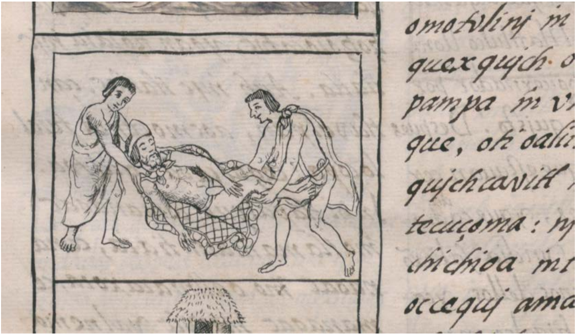
Figura 2. El cuerpo del Emperador Moctezuma rescatado de la laguna, en la Historia general de las cosas de Nueva España, 1575-1577. Biblioteca Medicea Laurenziana, Florencia, Ms. Med. Palat. 219, f. 447v.