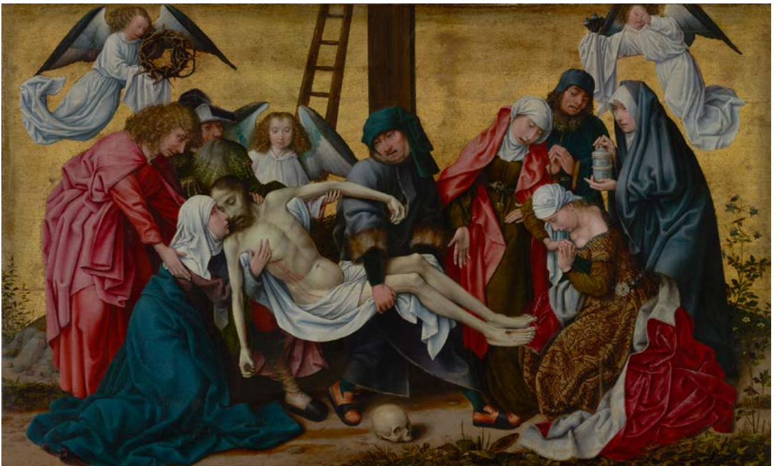
Figura 3. Seguidor de Rogier van der Weyden, La deposición de Cristo , ca. 1490. The J. Paul Getty Museum, Los Ángeles, Object Number 79.PB.20.