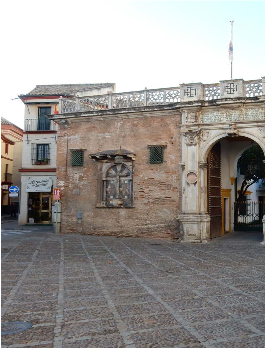
Figura 1. La Casa de Pilatos en Sevilla, 2017.